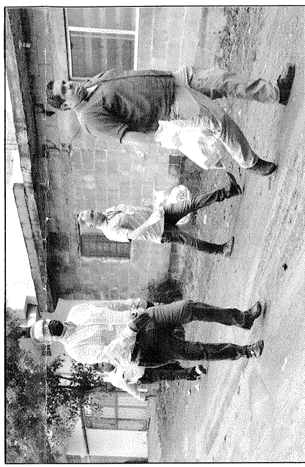
Con lluvia o con lodo, el alcalde camina por todos los rincones del municipio para llevar el apoyo a los afectados por el coronavirus.

Para todos los habitantes de Juárez que necesiten de estos apoyos alimenticios, solo tienen que comunicarse al teléfono: 81-34-23-84-90 en horario de las 9:00 a las 17:00 horas, una operadora tomará sus datos y después les será otorgada hasta su domicilio.